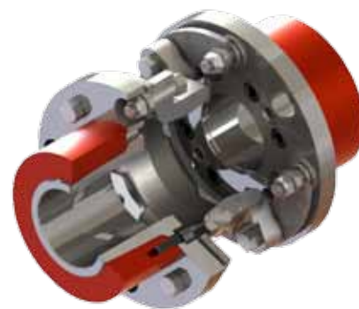
Acoplamentos tipo AMR com anéis de aperto NHR Thomas

A opção de anel de aperto NHR possui um anel de travamento positivo que elimina a necessidade de ajuste forçado entre os cubos de acoplamento e os eixos. Ao invés de aquecer o cubo de acoplamento para expandir o material antes de deslizá-lo sobre o eixo, os anéis NHR simplesmente deslizam sobre o eixo frio e são fixados com o uso de ferramentas comuns.