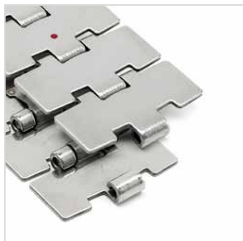
60M 84XM Execução Quick Linq