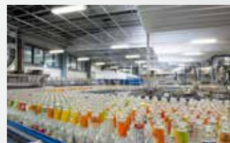
Ligne de remplissage retournable