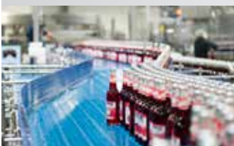
Ligne de remplissage à un sens